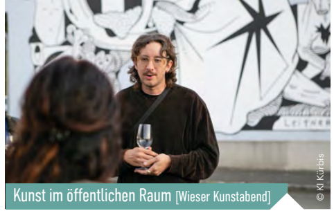
Kunst im öffentlichen Raum [Wieser Kunstabend]