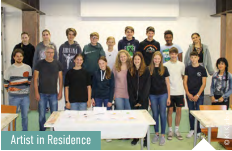
Artist in Residence