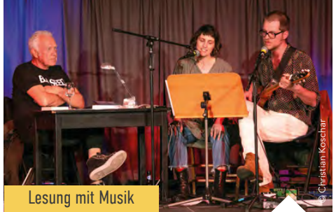
Lesung mit Musik