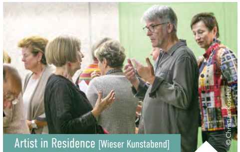
Artist in Residence [Wieser Kunstabend]