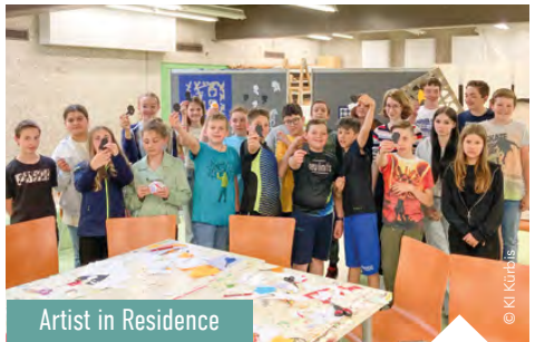
Artist in Residence