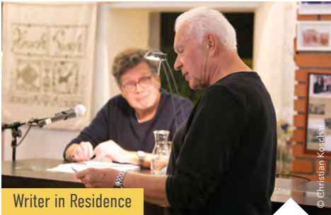
Writer in Residence

13. Oktober | Atelier im Schwimmbad Projektverantwortlich: Anja Senekowitsch