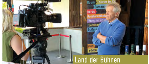
Land der Bühnen

Alle Veröffentlichungen 2023 unter www.kuerbis.at/pumpkin-records