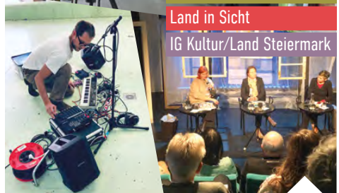
Land in Sicht