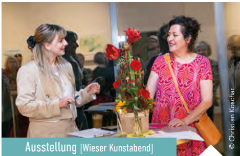
Ausstellung [Wieser Kunstabend]

7. - 17. September | Schlosstene Burgstall Regie: Wolfgang Fasching