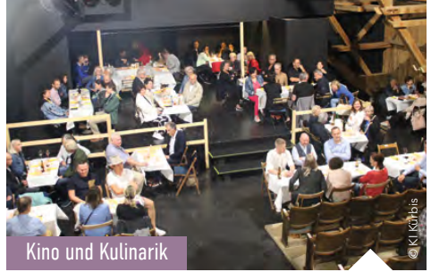
Kino und Kulinarik